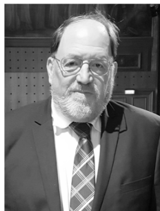
Джеймс Кеннет Гэлбрейт

Президент Вольного экономического общества России, президент Международного союза экономистов, директор Института нового индустриального развития им. С.Ю. Витте, эксперт РАН, почетный доктор РЭУ им. Г.В. Плеханова, почетный профессор УрГЭУ, доктор экономических наук, профессор