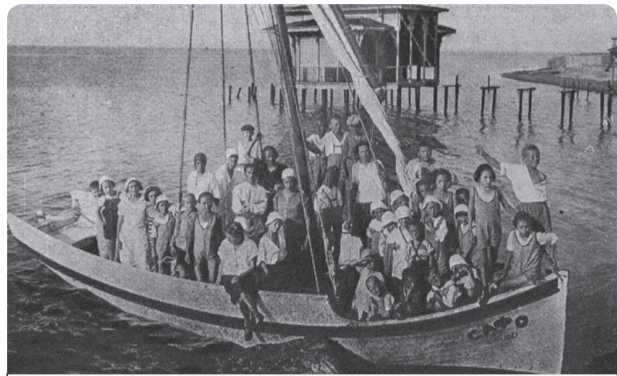
Катание на лодках. 1930-е годы