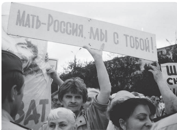
С такими лозунгами крымчане поддерживали проведение референдума в 1991 году

Поздравляя крымчан с круглой датой, глава РК Сергей Аксенов напомнил, что первый крымский референдум проходил в то время, когда на Украине активизировались адепты национализма, и стал «выражением векового стремления».