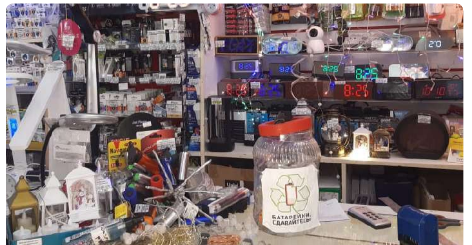
Пункт приема батареек на улице Интернациональной, 102

Вы знаете, почему важно правильно утилизировать отработанные элементы питания? «ЕЗ» расскажет не только об этом.