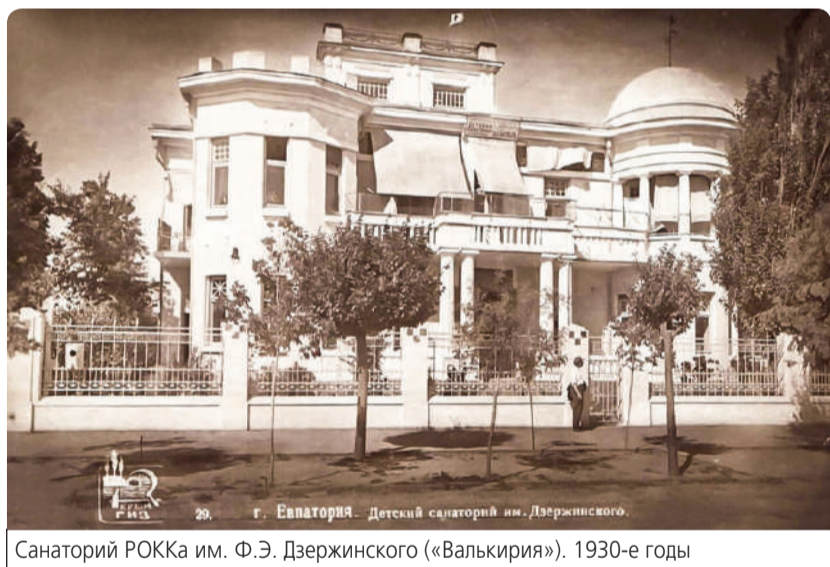
Санаторий РОККа им. Ф.Э. Дзержинского («Валькирия»). 1930-е годы