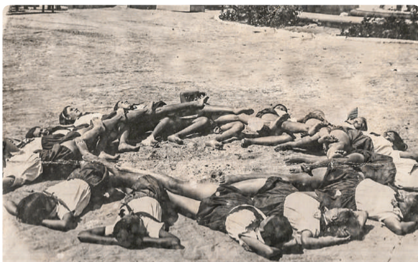
Прием солнечных ванн в детском санатории «Смена». 1930-е годы