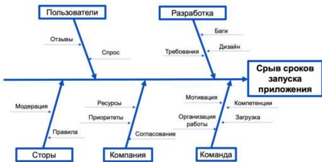
Рисунок 2 - Детализированный вид причинно-следственной диаграммы. Ошибки интеграции.