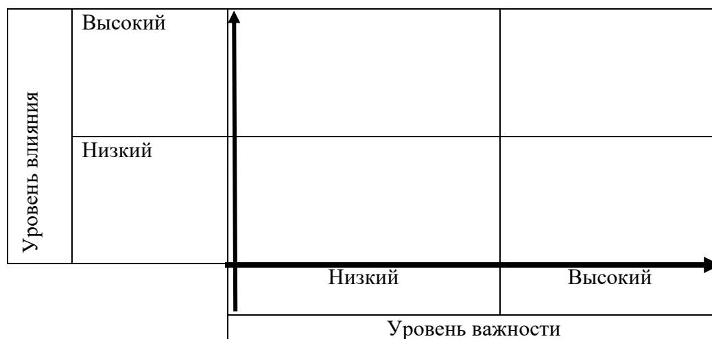
Рис. 1. Карта (матрица) рисков

Заполните карту (матрицу) стейкхолдеров (рис.1)