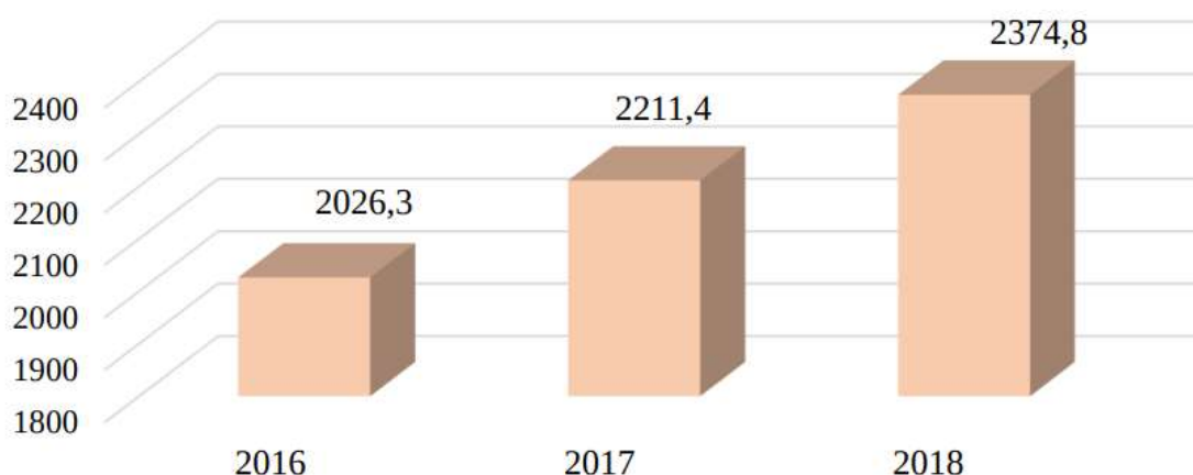
Рисунок 1. Оборот субъектов МСП в Свердловской области в 2016-2018гг, млрд. руб.

Оборот субъектов МСП Свердловской области в 2018 году по сравнению с 2016 годом увеличился на ____%. Особенно заметна положительная динамика оборота средних предприятий, прирост по которым составил ____%. При этом, необходимо учитывать то, что в 2015 году произошло изменение критериев отнесения к той или иной группе субъектов МСП, а именно, предельных значений ежегодного дохода для категорий субъектов МСП, которые были установлены постановлением Правительства РФ от 13 июля