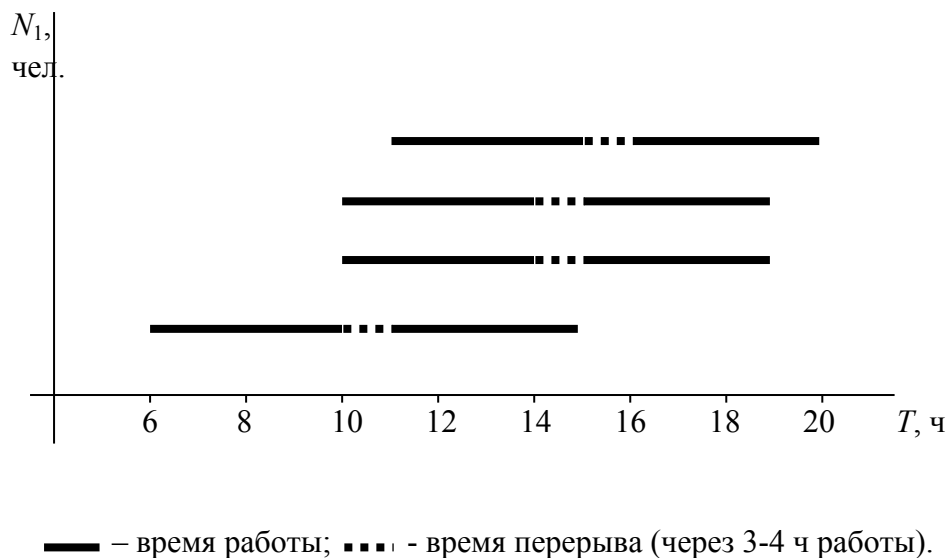
Рисунок 2 – График работы производственного персонала цеха

На основании расчета строят график работы производственного персонала горячего цеха (рисунок 2). Существуют линейный, ступенчатый, разобщенный графики. Ко всем графикам предъявляется одно основное требование – количество производственного персонала на каждом участке работы должно соответствовать трудоемкости изготовления продукции и обеспечивать его выполнение в назначенный срок.