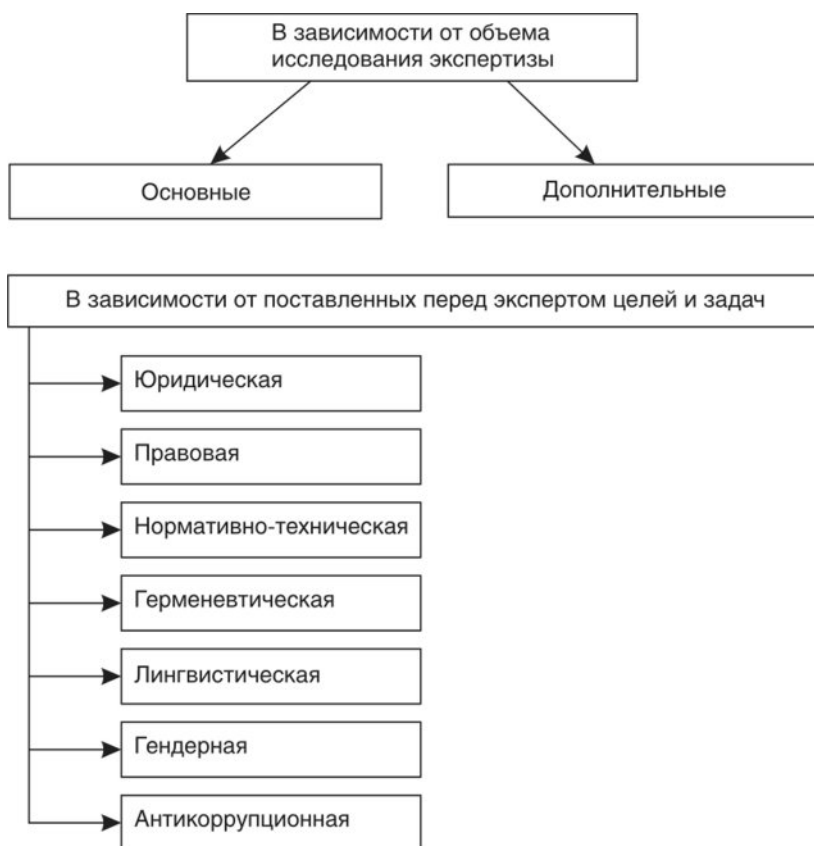
Рисунок 7 – Виды экспертиз юридических документов [12, с. 27]

Если рисунок является авторской разработкой на основании конкретного источника: