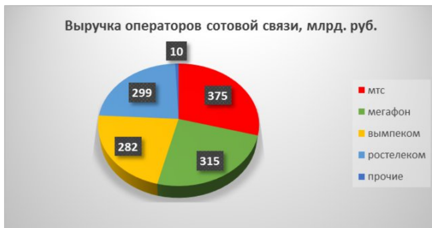
Рисунок 1 – Выручка операторов сотовой связи

Размер (объем) рынка - это реальные продажи продукта на данном рынке в определенный период времени. Прогноз выручки операторов сотовой связи на конец 2019 г. представлен на рисунке 1. Размер рынка телекоммуникационных услуг в 2019 году составит 1 280 млрд. руб.