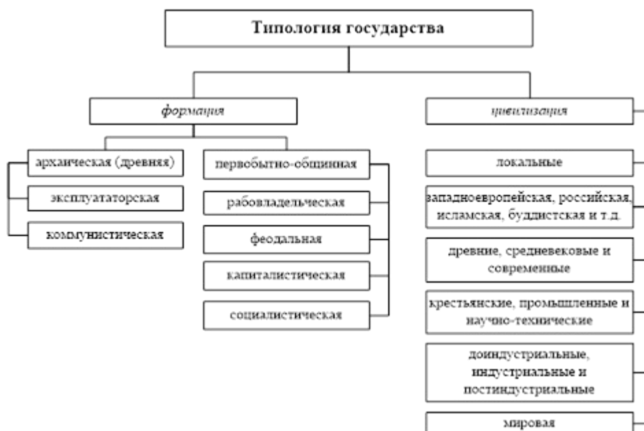
Рисунок 7 – Типология государства [12, с. 27]

Если рисунок взяли из первоисточника, без обработки: