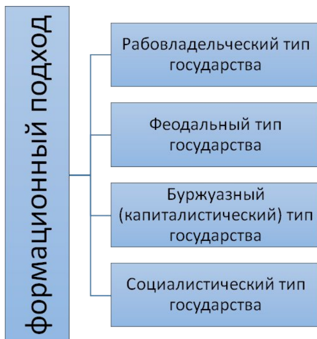
Рисунок 3 – Типы государства на основе формационного подхода 2 (подстрочная сноска внизу страницы)