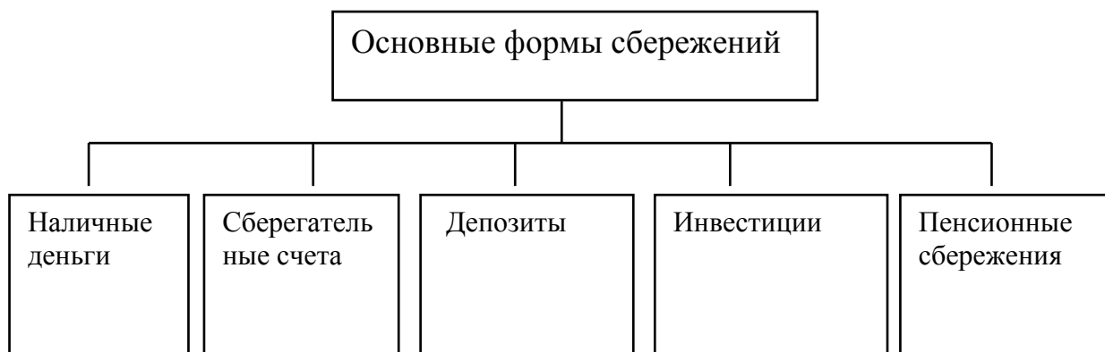
Рисунок 1 - Основные формы сбережений [14]

Если на рисунке отражены показатели, то после заголовка рисунка через запятую указывается единица измерения, например: