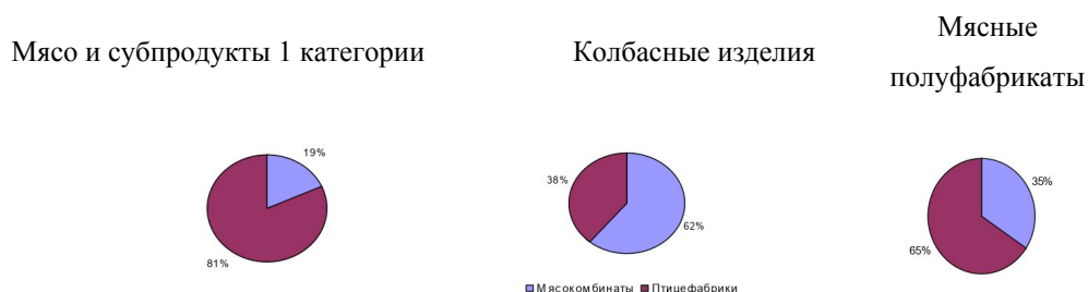
Рисунок 2 - Структура производства групп продукции мясокомбинатами и птицефабриками, %

Наибольший объем мяса, субпродуктов и полуфабрикатов выпускается птицефабриками, тогда как колбасы преимущественно специализация мясокомбинатов.