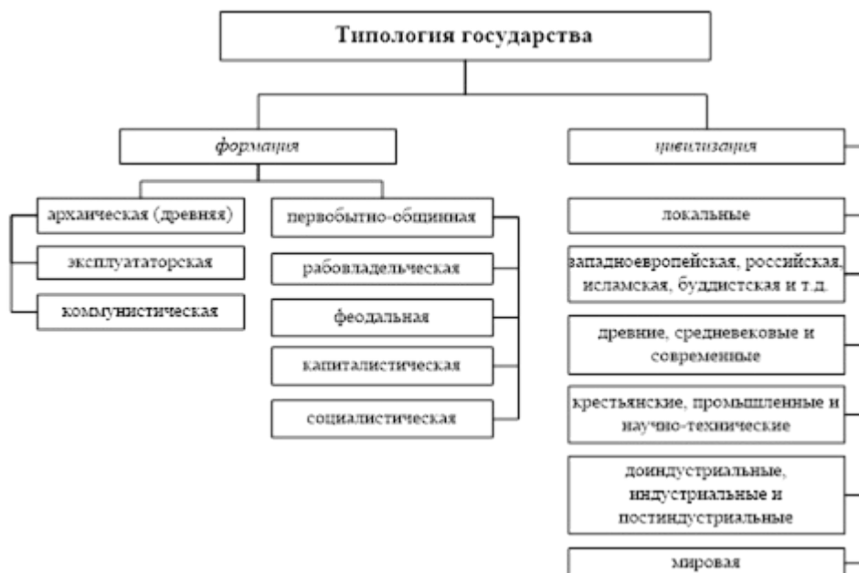
Рисунок 7 – Типология государства [12, с. 27]

Если рисунок взяли из первоисточника, без обработки: