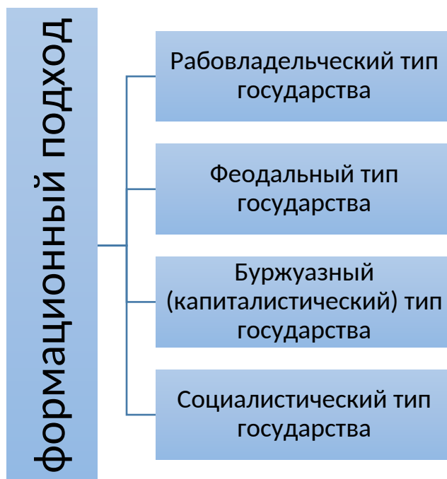
Рисунок 3 – Типы государства на основе формационного подхода 2 (подстрочная сноска внизу страницы)