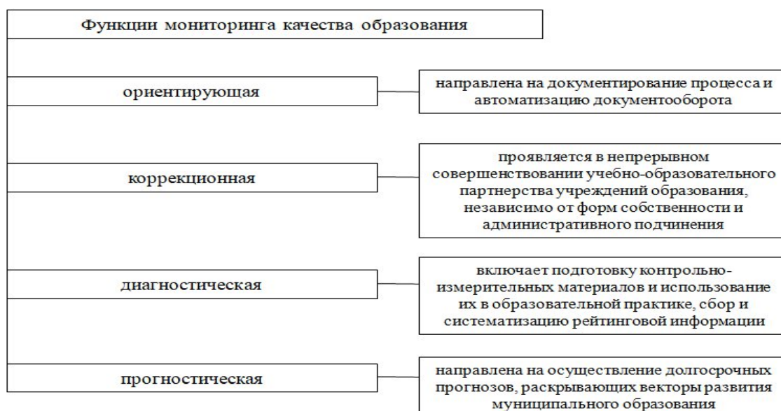
Рисунок 2 – Функции мониторинга качества образования [8, с.46]

Если рисунок взят из первичного источника без авторской переработки, следует сделать ссылку, например: